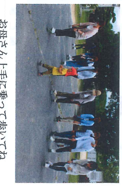
お母さん上手に乗って歩いてね