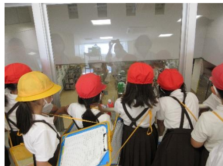
調理場の見学の様子