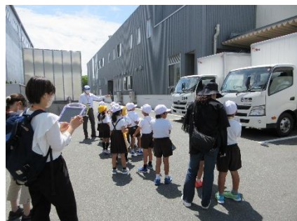
配送トラックの見学の様子