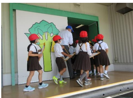
プラットホームの見学の様子