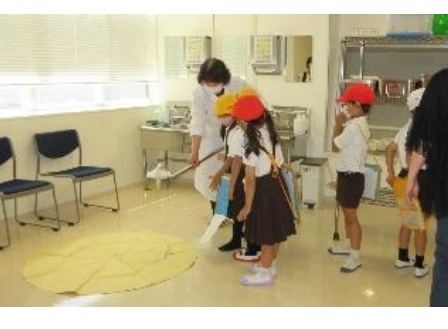
ひしゃくなどの器具の体験