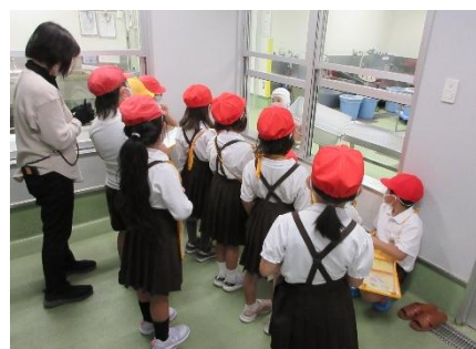
荷受室での説明の様子