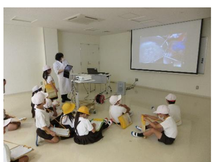
調理場を中継している様子