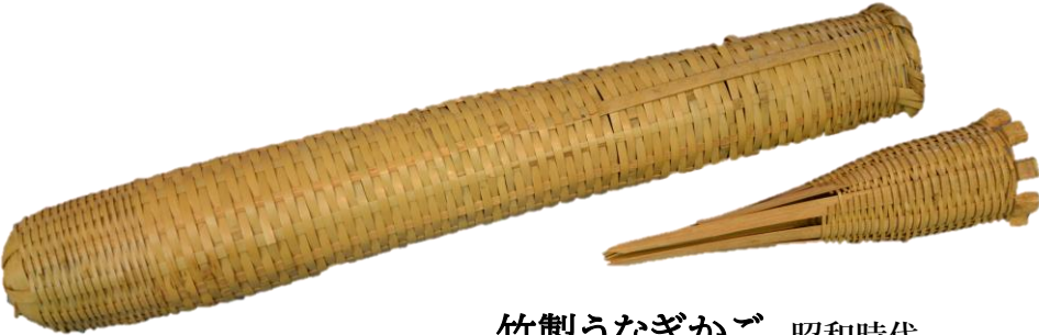
竹製うなぎかご 昭和時代 （館蔵）