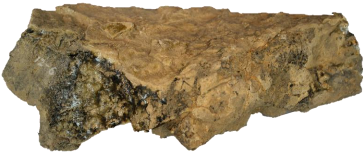
松山窯跡出土品 窯壁 6世紀後半 （館蔵） 表面の一部がガラス質になっている。これは、須恵器焼成による高温の熱によるものと推察されている。

【開館時間】9:00～17:00 【休館日】月曜（祝日の場合その翌平日も休館）・祝日（土曜日の場合は開館、月曜日を除く翌平日が休館）・年末年始（12/27～1/5） 【交通アクセス】 ■電車をご利用の場合 JR小野田線「南中川駅」下車、徒歩7分 ■バスをご利用の場合 「小野田駅前」からバスで宇部中央、本山岬、刈屋、理科大、叶松団地行きのいずれかに乗車、約7分 →「硫酸町バス停」で下車、徒歩3分 ■車をご利用の場合 山陽自動車道「小野田IC」より 約10分