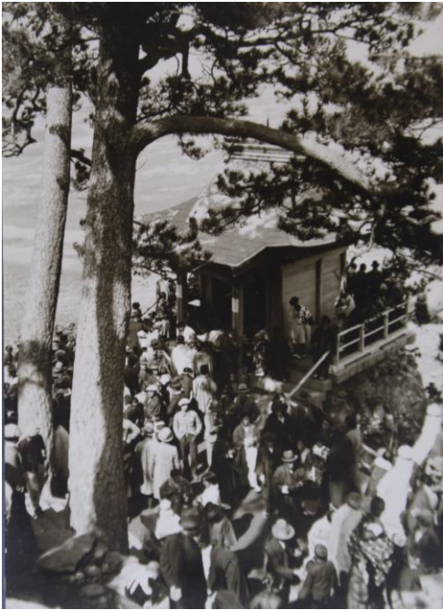
子持御前写真 昭和22年（1947） （館蔵） ※パネル展示 子持御前の祭礼日には、「蟻の御前詣り」と例えられるように多くの人々が参詣した。

※この他、特設コーナーでは、山陽小野田市ふるさと文化遺産「コーストウォーク」に関連する写真パネルを展示します。