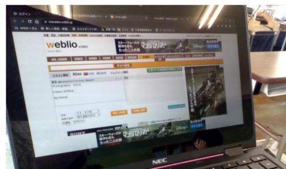
Weblio 英和和英辞典を使って発音確認