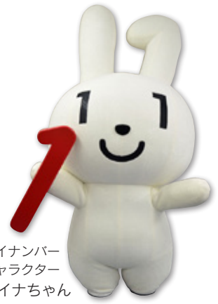
マイナンバー キャラクター マイナちゃん