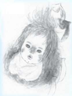
▲「おとなになれなかつた弟たちに…」

文化の薫るまちになあれ… 不二輸送機ホール (山陽小野田市文化会館) 休館日: 第1・第3火曜日