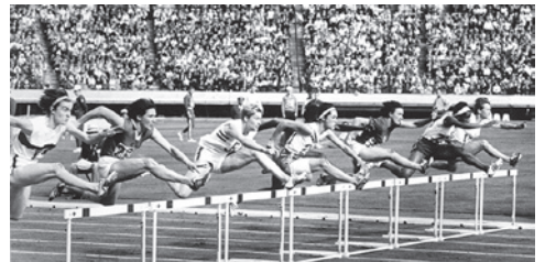
▲東京オリンピックの一場面