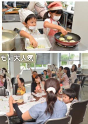
クイズは子どもに大人気！

食 育の大切さをPRしていく人材を養成することを目的とした、ねたろう食育博士養成講座親子コースが7月5日、小野田保健センターで開催されました。全2回の1回目となる今回は、6組15人の親子が参加。講話では、市の農林水産物、名産品を知り、また食育の大切さも学びました。キッチンガーデニングでは、生産者のアドバイスをもとに「苦いピーマン」「苦くないピーマン」の2種類の苗を植え、自宅に持ち帰って「育てる」「収穫する」「食べる」を体験していきます。調理実習では、食生活改善推進員（ヘルスマイト）と一緒に、親子で地元の食材を使った料理を作りました。受講生は講座と筆記試験を経て、「ねたろう食育博士」を目指します。