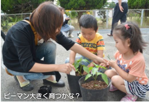
ピーマン大きく育つか？