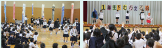
▲手をつなぎ1年生が入場 ▲企画委員による楽しい集会

赤崎小学校と松原分校では、授業交流、図書館開放、ペア読書など様々な心の交流が「いつもいっしょ」に行われています。