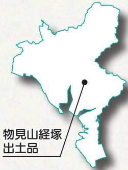
物見山経塚出土品