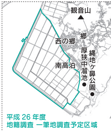
平成26年度地籍調査 一筆地調査予定区域

平成26年度は、西高泊地区(大字西高泊の一部)0.77km 2 を調査します。この調査区域内に土地を所有している人は、説明会に出席してください。