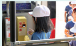
▲整理券をとって乗るよ