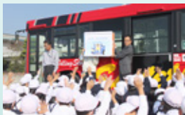
▲答えが分かったよ

今年度から、市教育委員会の事業として「こども市民教育推進事業」が始まりました。社会的責任や地域との関わりなどを教えることで、将来を担う子どもたちが、積極的に社会に参加する良識ある市民に育つことを目指しています。市役所の各課が行う「出前講座」を基本に、小中学生向けにアレンジした講座が2学期に7校で行われ、3学期にも6校で予定されています。11月1日には、厚狭小学校の1年生を対象に、商工労働観光課による「バスの乗り方教室」が行われました。クイズ形式でバスの乗り降りの仕方について学び、本物のバスを使って乗車体験をしました。児童からは「自転車が来たらいけないから、降りるときは左右を見るんだよ。」「家族とバスでお出かけしたいな。」などの声が聞かれました。