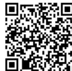
申込 QR コード

8 目的・趣旨 地域住民の、生涯を通じた健康づくりの実践活動を促進するために、食育の大切さをPRできる食育博士を養成する。