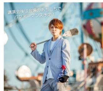
講演会後は会場のおちろで パフォーマンス予定！