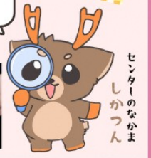
センターのなかま しかつん