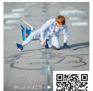
申し込みはこちら

【場所】Aスクエア2階会議室【定員】100人(先着順)【参加費】無料 【申込締切】6/23(火)【問合せ】障害福祉課(TEL 82-1170)