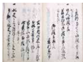
馬関軍中日記(館蔵)

その後、明治5年(1872)に「廣輔」と改名したこと、明治16年(1883)1月24日に急死し正福寺(現洞玄寺)に埋葬されたことなどが記録に残されています。