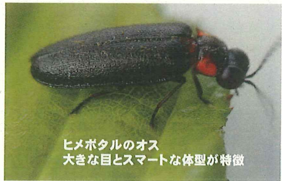
ヒメボタルのオス 大きな目とスマートな体型が特徴