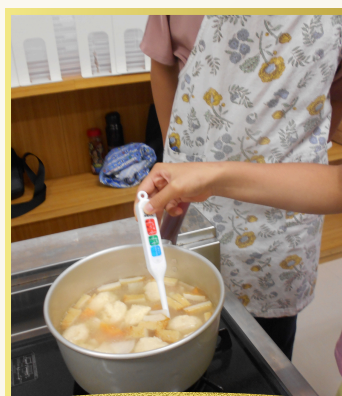
正しい食の知識の習得

その他、噛むかむ口腔チェック、市販品のカロリー&塩分チェック、 市民健康体操など、楽しく学ぶ内容盛りだくさん！