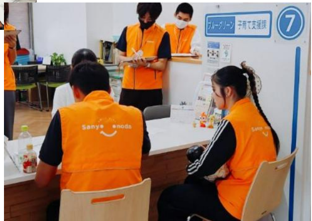
窓口業務改善ワーキング 体験調査