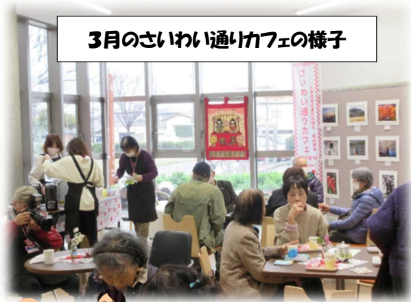
3月のさいわい通りカフェの様子

昨年度から始まった、小野田地区運営協議会福祉部会主催の「さいわい通りカフェ」を、今年度も行っています。スタッフの入れてくれたおいしいコーヒーなどをいただきながら、楽しくおしゃべりしませんか？どなたでもご参加できます。お待ちしております！！