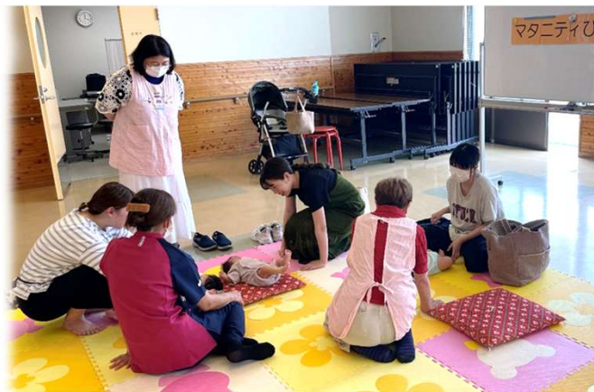
マタニティひろばの様子