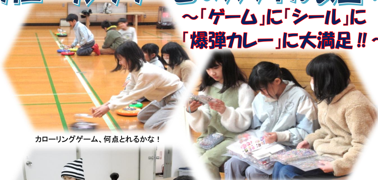
カローリングゲーム、何点とれるかな!