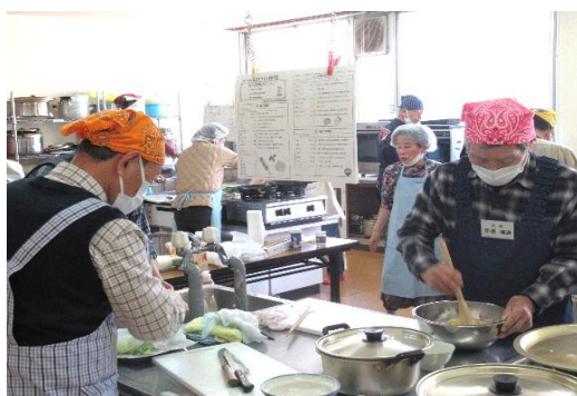
大奮闘中のおやしシェフの皆さん！

令和7年度男性料理教室の成果発表として、3月16日、地域の方々に自分たちが作った料理を食べさせていただき、一日限りの「おやし食堂」を開店しました。今回の定食メニューは、鶏のつくね焼き・かぼちゃのサラダ・酒かすみそ汁と、塩分控えめ、栄養満点の料理でした。定食を食べながら「美味しい!!」の連発で、初めはどうなるか心配でしたが、皆さんの笑顔にホッとしました。「来年も頑張ろうね」とシェフ全員が最後に話されていました。ご来店いただいた皆さん、ありがとうございました♡