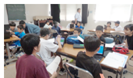
夏休み寺子屋教室