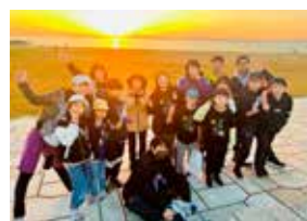
ゴール後に参加者と記念撮影