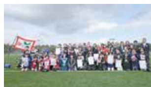
第1部入賞者記念撮影