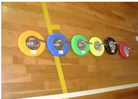
ジェットローラー