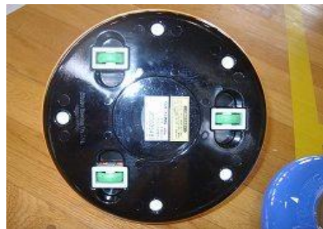
ジェットローラー(裏)