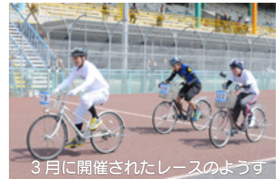
3月に開催されたレースのようす