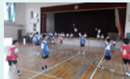
▲バスケットボール大会