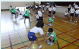
▲始業前トレーニング

埴生小学校では、週に2回希望者による始業前トレーニングを実施し、先生と児童と一緒に体力づくりの運動をしています。また、昼休みには、運動委員会の児童が主催するスポーツ大会があり、1学期にはバスケットボール大会が行われました。児童からは「他の学年の人たちと一緒に運動したり応援したりして、気持ちがいいです。」という感想が聞かれました。