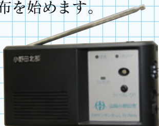
▲山陽小野田市防災ラジオ

災害時の緊急情報（避難勧告等の発令、避難所開設のお知らせなど）を受信した場合、自動的に電源が入り、最大音量で放送が流れる「山陽小野田市防災ラジオ」の配布を始めます。