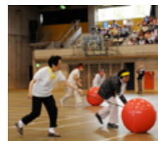
▲昨年の大会のようす