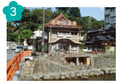
3 長門湯本温泉 (長門市)