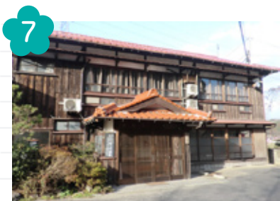
7 湯ノ峠温泉 (山陽小野田市)