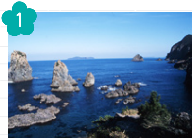
1 青海島 (長門市)