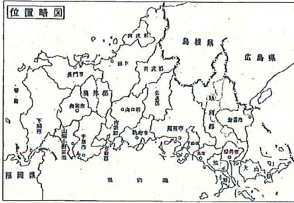
令和7年度県事業負担金に係る予定箇所図