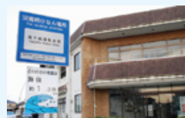
▲設置例 (高千帆福祉会館)