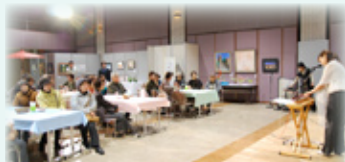
昨年の活動のようす(コンサート)