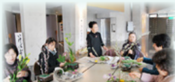
昨年の活動のようす(いけばな教室)

地元の芸術家で結成した“アーティストBOX”のみなさんが分野を越えてコラボレーションし、文化会館の小ホールをギャラリーに変身させます。ゆっくりとした空間の中で、書道、華道、音楽などが織りなす、文化会館の雰囲気をお楽しみください。