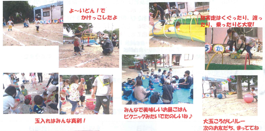
よ~いどん！でかけっこしたよ

10月18日(金)にミニ運動会を開催しました。年々、参加者が減ってきて寂しいですが、走って隔って玉入れをしてと楽しく過ごせました。もちろんスタートできないことあり、レーンから外れることあり、途中で大号泣などハフニングだらけ！でも、みんなよく頑張っていました！お母さん、お父さんも子供と一緒にがんばってくれました。可愛さいっぱい楽しいミニ運動会になりました。