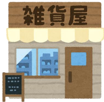
空き家、空き店舗を改装して お店を開業