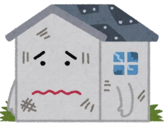
6か月以上使用されていない 空き家