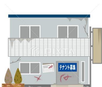
3か月以上使用されていない 空き店舗

指定地区内の空き店舗や空き家をリフォームして 利活用する場合に補助金を交付します。