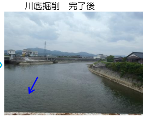
※水位が同じときの写真です。写真手前の川底の土砂を掘削しました。