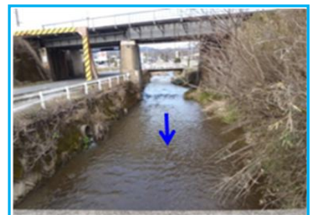
現況の桜川（山陽本線付近） ※川幅が狭く、JRの橋脚もあり、現位置での拡幅は困難。