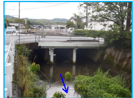
桜川橋（旧国道2号の橋） ※橋脚が2本あり、洪水の流下の阻害になっている。