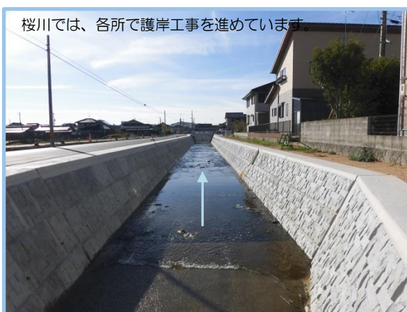
桜川の工事の状況