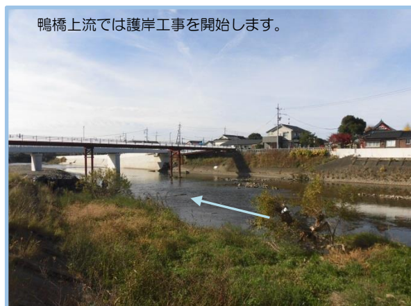
鴨橋周辺の工事の状況（鴨橋架替と護岸）