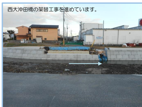
西大沖田橋の工事の状況

厚狭川および桜川周辺においては、工事に伴う騒音・振動や交通規制及び工事用車両の通行等でご迷惑をおかけすると思っておりますが、細心の注意をはらって施工いたしますので、何卒ご理解とご協力をお願いいたします。