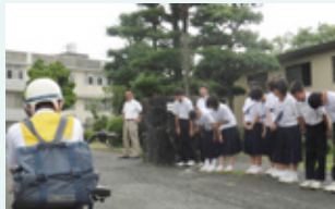
▲生徒会の役員が率先してあいさつをします。

1学期の生徒総会では、生徒会の役員を見習って、全校生徒が順番であいさつ運動に参加することが決まりました。みんなの心がけでよき伝統が継承されています。