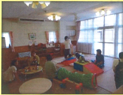
自由開放日は、0歳から年長児の子どもたちが楽しく遊んでいるよ！