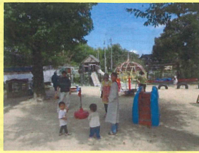
気候がよくなって、外あそびが満喫できるから嬉しいな♪