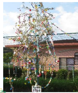
大休団地子ども会