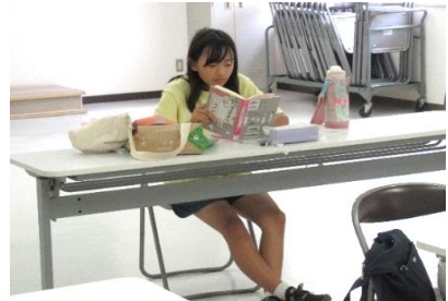
読書感想文教室:読書に集中!

また、子どもたちのパワーに負けないくらい熱くご指導いただいた先生方、書道クラブ・卓球クラブ・手芸クラブの皆さん、ありがとうございました♪