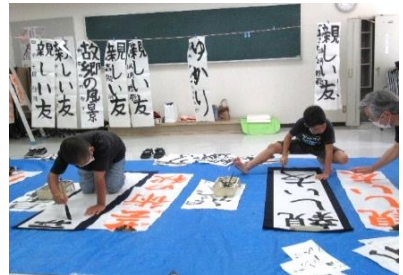
習字教室:大きな字に挑戦!