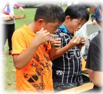
幸せいっぱい、口いっぱい☺