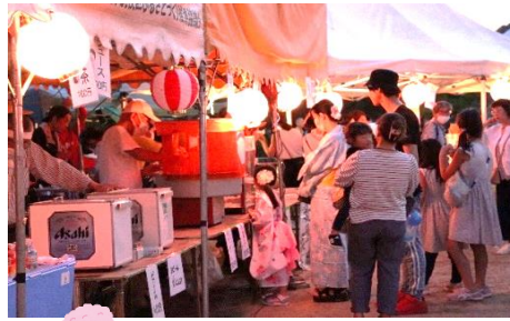
長蛇の列の綿菓子