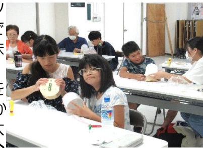
工作教室:配線の接続に悪戦苦闘

工作教室では、太陽光で電気を創り、蓄電し、省エネのLEDでかしく電気を使うことを学び、太陽光LEDランタンを作りました♪