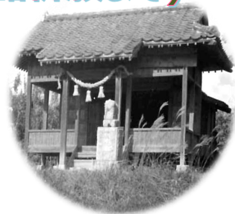
昔の疫神社(昭和30年代)

疫神社とは、八坂神社の境内ある摂社の一つです。摂社とは本社に付属し、その祭神と縁故の深い神を祭った神社のことで、本社と末社との間に位置するものです。本社の境内にあるものを境内摂社、境外にあるものを境外摂社といいます。