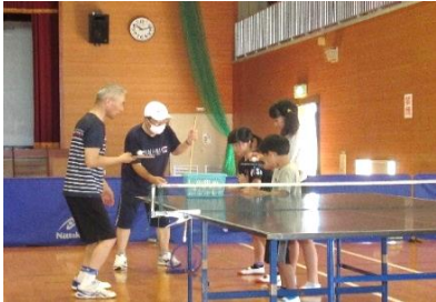
卓球教室:先生教えてください!