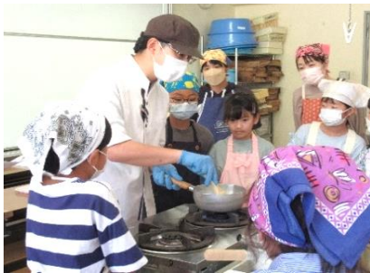
お菓子作り教室:フルーツゼリー

お菓子作り教室では、フルーツゼリーとスポンジケーキを親子で協力しながら一生懸命作り、美味しく仕上がりました♪