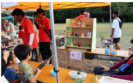
狙いを定めて…射的

8月12日、盆踊り大会が開催されました。慰霊祭が終わると、地元の皆さんによる太鼓で盆踊りが始まり、途中、七夕飾りの表彰式が行われました。表彰式では、ユーモア賞：共和台子ども会、アイディア賞：中村子ども会、がんばったで賞：大休団地子ども会が受賞されました。また、最後に登場した仮装踊りでも大変盛り上がりしました。