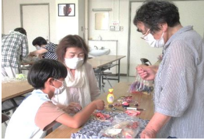
手芸教室:しじみの貝殻を利用!

今年度は、毎年大人気の習字教室、卓球教室、読書感想文教室に加えて、キーホルダー作りの手芸教室も開催しました。各教室とも2時間と短い間でも、さすがに子どもたち!習字はバランスよく文字が書けるようになり、卓球ではラリーが続くようになり、みんな本当によく頑張りました😊