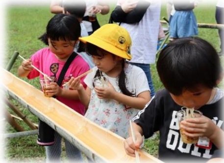
はしで上手につかめました☺!!