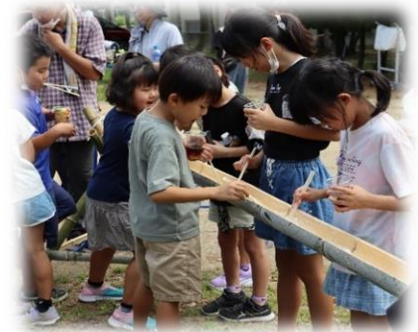
何が流れてくるかな☺??

猛暑の8月26日、有帆小学校の環境整備終了後、有帆地区社会福祉協議会のファミリークラブ行事として育友会と合同で「そうめん流し」を行いました。