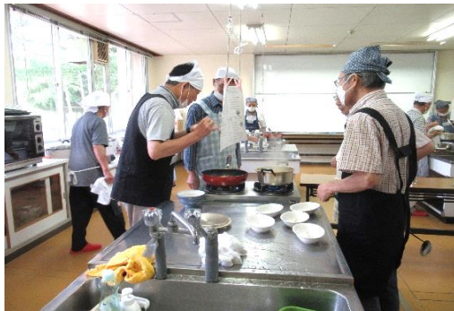
おやじシェフの皆さん奮闘中です!!