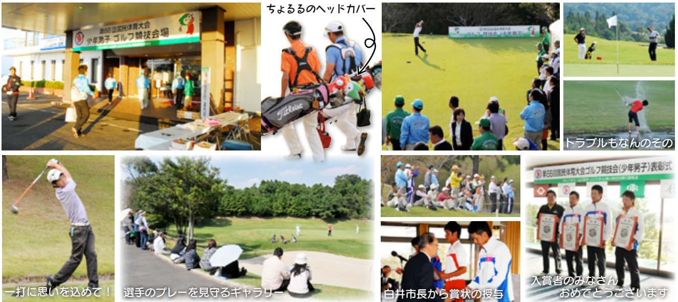
ちよるるのヘッドカバー

28道府県から84人の選手が、各チーム3人の2日間の合計打数(432:パー72×3人×2日間)を競い、岡山県チームが430(-2)というスコアで初優勝しました。山口県チームは453(+21)で9位と惜しくも入賞を逃しました。