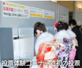
投票体験コーナーで初の投票