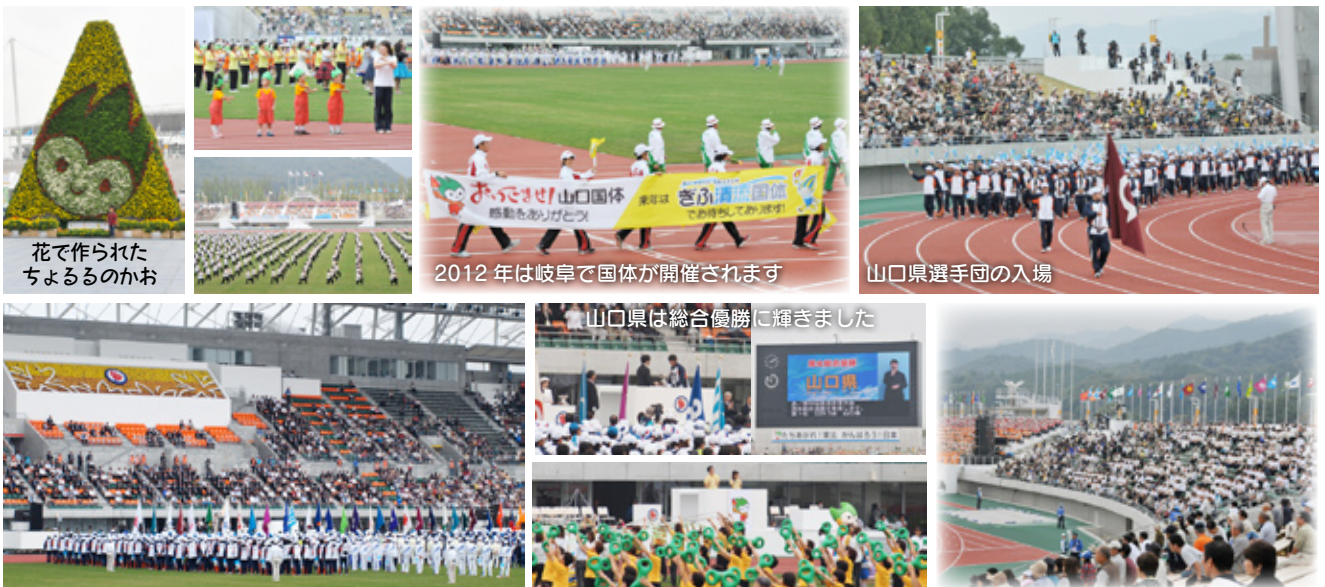
花で作られた ちよるるのかお