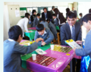
▲外国人の先生も来られます ▲英語で注文をとります