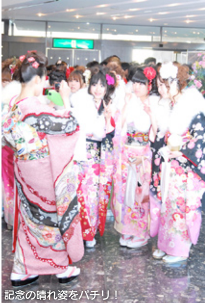
記念の晴れ姿をパチリ！