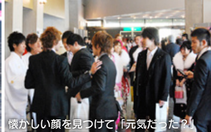
懐かしい顔を見つけて「元気だった?」