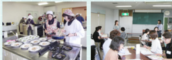
食生活改善推進員養成講座のようす