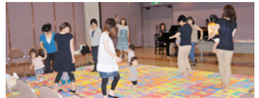
▲音楽に合わせて楽しく遊びます。