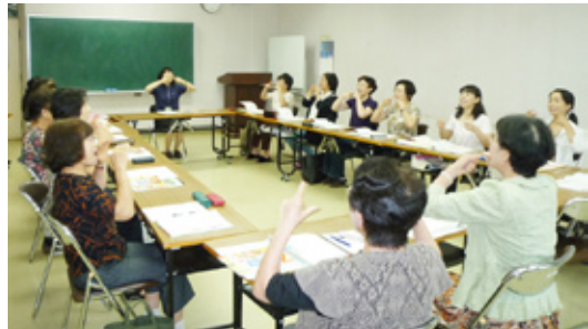
▲物忘れ予防サポーター養成講座の様子