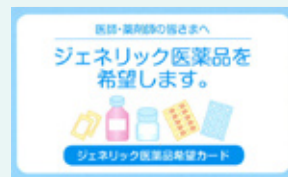
◀ジェネリック 医薬品 希望カード

ジェネリック医薬品を希望される場合は、ジェネリック医薬品希望カードなどにより、医師・薬剤師にご相談ください。なお、国民健康保険加入者でジェネリック医薬品希望カードが必要な人は、国保年金課に備えていますのでご利用ください。