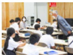
小学生への歴史学習

室」を開催しています。教室では日本語の学習に加え文化や伝統も体験でき、6月にはゆかたの着付け体験をしました。今後も多くの人が集い、笑顔があふれるセンターをめざして頑張ります！