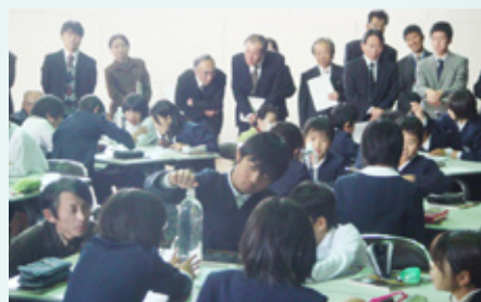
▲食塩の溶解方を観察する子どもたちの様子を先生方がじっと見守っています。

体育館での公開授業のあと、理科の指導の仕方や各校の課題、今後必要な取り組みなどについてグループ協議が行われました。「どうしたら子どもたちが、実験や観察の楽しさを味わいながら、科学的な見方や考え方を身に付けることができるか」などについて、意見が交わされ、よりよい授業づくりに向けて、有意義な研修会となりました。