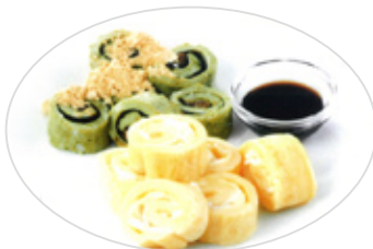
▲「ネギ・コン和洋ロール」 料理のレシピなどは、市役所ロビーに展示しています。