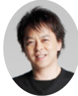
須川 展也 (サクソ)

※チケットは好評発売中です。発売所は広報「さんようおのだ」11月15日号 19 ページをご覧ください。