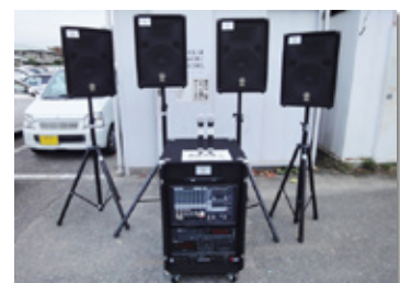
▲助成により購入した放送設備