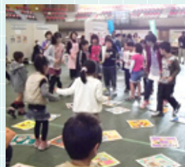
▲食育ジャンボかるた大会のようす