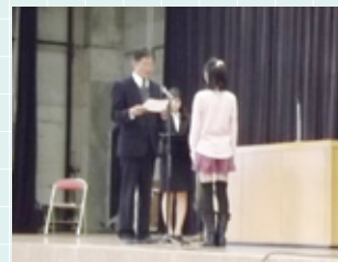
▲ねたろう食育博士認定式