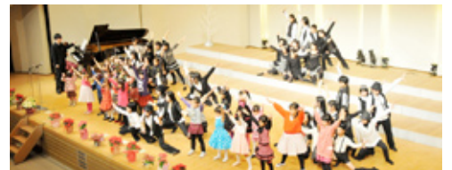
▲迫力ある歌とダンスで会場を盛り上げました(昨年)