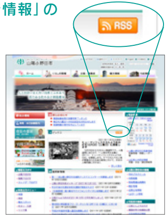
▲市ホームページのトップページ http://www.city.sanyo-onoda.lg.jp/

市ホームページにあるRSSのアイコンをご存知ですか。RSSとはホームページの見出しや要約などを構造化して記述するXML技術を応用した書式で、主にウェブサイトの更新情報を公開するのに使われています。市ホームページでは、RSSによる「新着情報」の見出しとリンク情報を公開しています。この機能を使うと、市ホームページにアクセスしなくても、新着情報を簡単にチェックできるようになります。