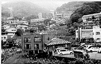
静岡県熱海市における土石流の被害状況