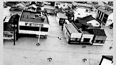
熊本県人吉市街部における浸水状況