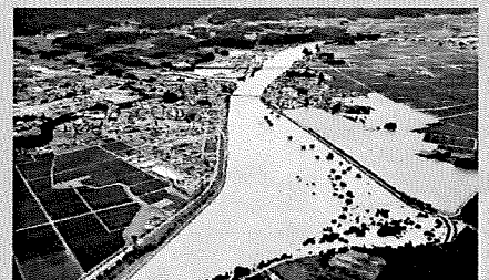
山形県大石田町最上川沿川の浸水状況