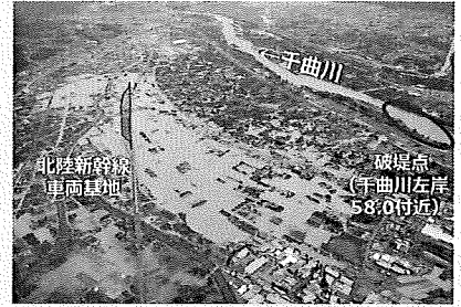
長野県長野市千曲川沿川の浸水状況