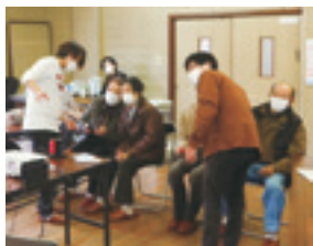
▲高齢者サロン「サロン川上」で交流を楽しむ利用者