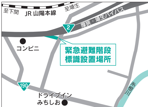
【位置図】 設置場所：大字埴生（埴生系根）

この避難階段の設置により、大規模浸水等が発生した場合でも、建物から浸水区域を経由せずに道路高架区間など高台への安全な避難が可能となります。