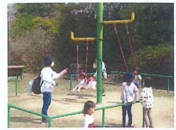
ブランコ上手にこぎかき!