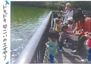
下木トキ♡こいのエサやり