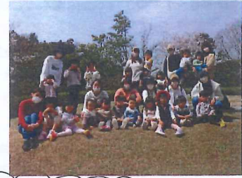
みんな大好き♡あがとう!

天候にも恵まれ、ウレシげな思い出でした!! 1人のえんそく公園とあそびと大興奮の子どもたちでした!