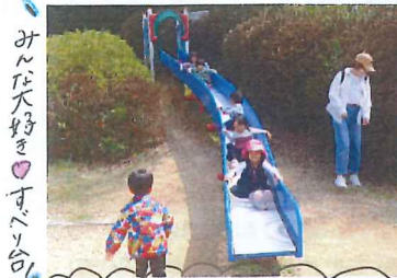
みんな大好き♡すべり台!