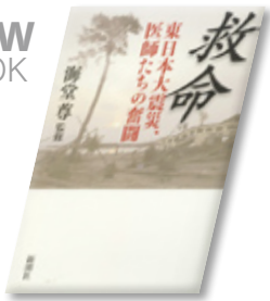
救命 海堂 尊 監修 (新潮社)