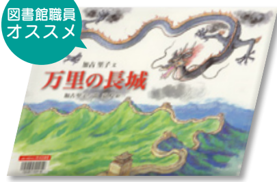
万里の長城 加古 里子作・絵 常 嘉煌 絵 (福音館書店)

地球の誕生や中国の歴史を万里の長城からひもときます。平和の願いが込められた作品。