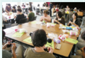
▲エコわらじを編む様子 (女団連交流研修会)

子どもたちが自分のエコわらじを持つことで、お茶碗や箸を自分で洗ったりと楽しみながら食に関わる機会を増やし、さらには、エコわらじをきっかけに家庭で食を話題とした家族の団らんの時間が増えるきっかけになってほしいと考えています。