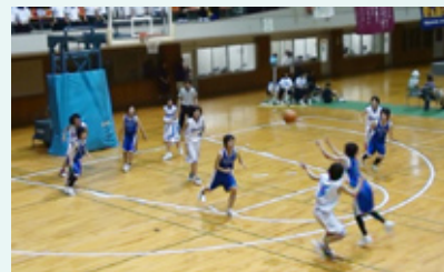
▲山口県選手権大会準決勝のようす (女子バスケット部)

「おはようございます」「おはよう」高千帆中学校では今日も明るく元気なあいさつが交わされています。3年生が模範となり「なりたい自分」へ向かって、規律正しく、協力しながら努力する姿があふれており、部活動では中国大会出場等の素晴らしい成績を収めています。家庭学習にも前向きで、生徒全員が毎日自主学習に取り組んでいて、生徒の中からは、「最初のうちは、土日も続けるのはつらかったけど、苦手なところの勉強を続けているうちに自信がついてきました。」という声が聞こえてきました。9月10日には運動会を予定しています。全力でそれぞれの夢の実現に向けてがんばっている生徒の姿を、ぜひ一度ご覧ください。