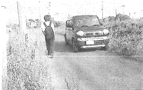
狭くて不便な理科大横の宇部市道

A 再三、宇部市に道路拡幅のお願いをしていますが、拡幅計画はないとの回答でした。