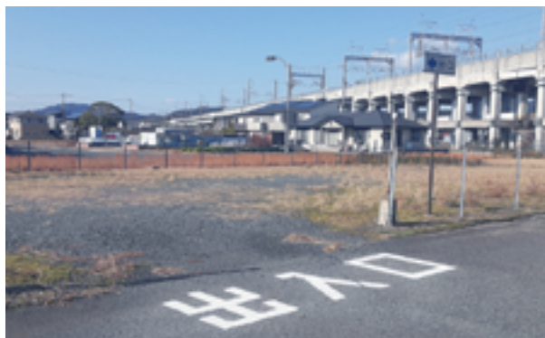
厚狭駅南口駐車場未舗装部分