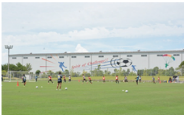
市立サッカー交流公園

指定期間は、令和10年3月31日までの5年間、指定管理料は2億9813万円（税抜き）です。