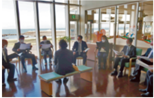
きらら交流館での現地視察

③ 山口東京理科大学グラウンド等整備事業について整備中のグラウンドおよび数理情報科学科の教室棟建設予定地等を現地確認しました。