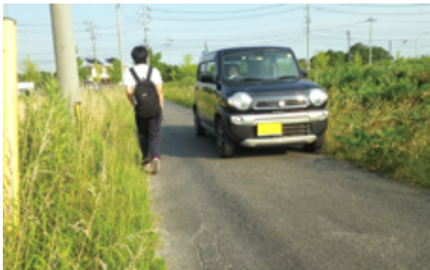
狭くて不便な理科大横の宇部市道

A 再三、宇部市に道路拡幅のお願いをしていますが、拡幅計画はないとの回答でした。