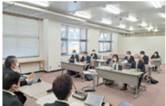
山口市での現地視察