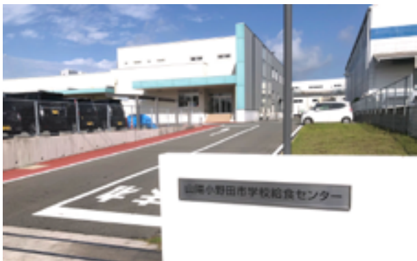
山陽小野田市学校給食センター

A 日頃から納入業者に市内産や県内産の納入協力を依頼しています。特に6月、11月、1月の県地場産給食週間には強くお願いしています。