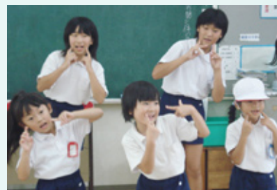
▲昼休みのひとコマです。1年生と6年生のダンスの共演。明るい笑顔で発表会さながらの熱演です。

地域のみなさん、笑顔と信頼、優しさに満ちた小野田小学校にぜひ足をお運びください。