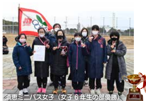
須恵ミニバス女子 (女子6年生の部優勝)