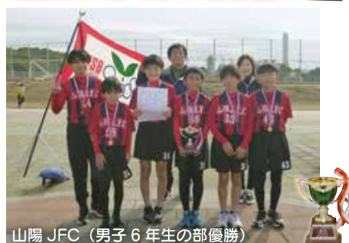
山陽 JFC (男子6年生の部優勝)