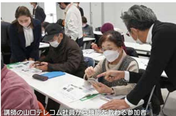
講師の山口テレコム社員から機能を教わる参加者

高 齢者を対象に、便利なコミュニケーションツール「LINE」の使い方を基礎から学ぶ「今さら聞けないLINE 教室」を、12月14日に厚狭地区複合施設、15日に小野田地域交流センターで開催し、両日で約80人が参加。参加者は「孫と通話がしたい」「新しい機能を知れてうれしい」と話しました。