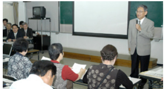
▲市政説明会のようす