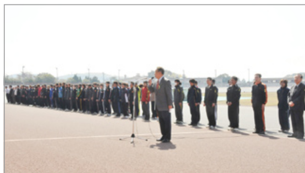
▲東日本大震災被災地支援オートレース開催初日の4月14日にレース場であいさつをする白井市長

5月17日(火)から5月23日(月)まで市議会の臨時会が開催されます。約7億円にまで減った山陽オートの累積赤字を、平成23年度の収入をもって補てん(繰上充用)するための補正予算と、教育委員会委員等の任命の同意を求める議案などを提出しています。教育委員候補は、初の公募委員です。