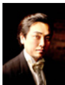
藤田卓也 (声楽家、演出)